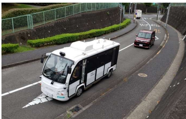
▲昨年9月の実証実験の様子