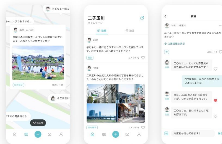
▲「投稿機能」イメージ

身の回りの知りたいことや、疑問などを投稿することで、利用者同士で街の課題を共有することができます。また、コミュニケーションできる範囲を駅を基点とした生活圏単位とし、「同じ街に住む、働く特定多数の人とのコミュニケーション」によって、地域にひも付く課題を解決する共助の関係を後押しします。