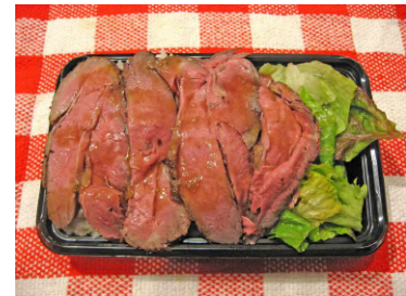
南町田の提供メニュー(抜粋)