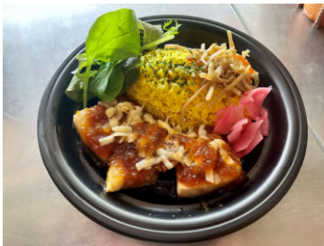
渋谷の提供メニュー(抜粋)

アサヒスーパードライにあう選りすぐりのキャンプグルメを提供するキッチンカーを出店します。