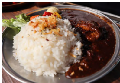
たまプラーザの提供メニュー(抜粋)