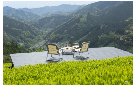
▲ 絶景の茶畑プライベート空間「ティーテラス」