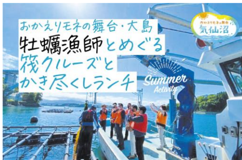
▲ 気仙沼牡蠣筏見学・乗船体験 (気仙沼地域戦略)