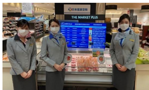
東急百貨店での販売

東急(株)グループは、ANA グループ、日本産直空輸と連携を強化し、旅客機の貨物スペースを活用した航空のスピード輸送と、産地、地上配送、小売店の連携による新しい流通である「産直空輸」での販売を拡大します。