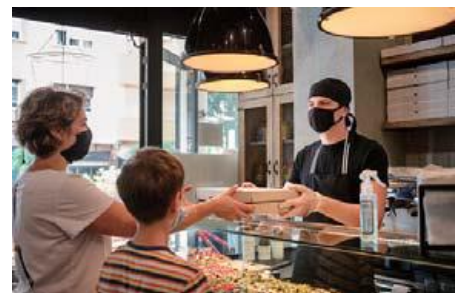
多彩な食を楽しむフードホール（イメージ）

さらに、緑を感じることができる植栽計画や広場設計に加え、壁面緑化や屋上菜園の整備、再生可能エネルギーの活用など、環境配慮型の公園整備・運用を行います。