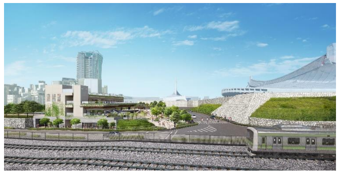
外観イメージ（JR 山手線方面から望む）