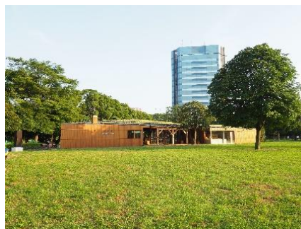
都立木場公園多面的活用プロジェクト 「Park Community KIBACO」