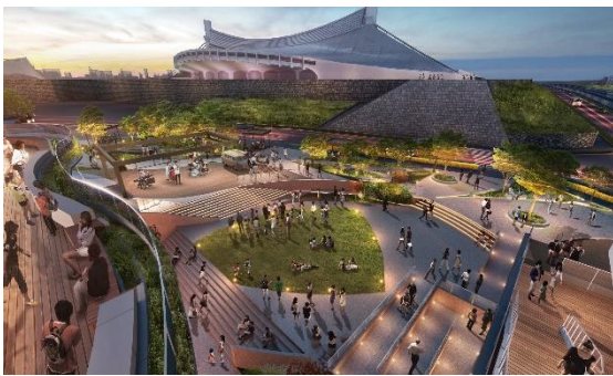
にぎわい広場（夜）のイメージ