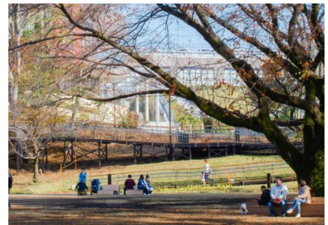
隣接する南町田グランベリーパーク との一体整備「鶴間公園」