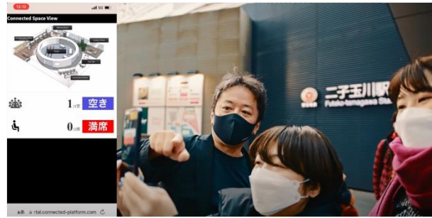
<リアルタイムの空き状況確認>