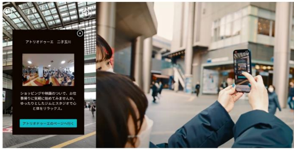
<AR ナビゲーションの利用シーン>