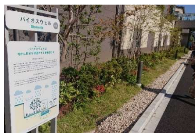
▲雨のみち: バイオスウェル

調整池や雨水貯留槽などの従来型の雨水流出抑制策に加え、自然環境が有する機能を活用するグリーンインフラを採用。敷地周辺を囲むように石を敷き詰めた隙間の多い溝状の「雨のみち: バイオスウェル」と、くぼ地状の植栽帯である「雨のにな: レインガーデン」をランドスケープのデザインへ取り込みました。