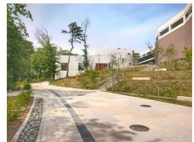
▲パークライフ・サイト内歩行者空間