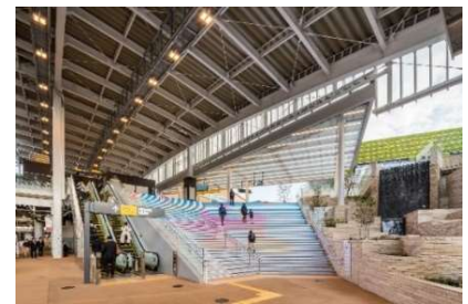
▲まちと一体感のある鉄道駅舎

まちの玄関口となる駅舎は、駅南北の往来を可能とする自由通路の架設やホームドアの設置などによる安全性の向上に加え、ホームからまちへと繋がる大階段や植栽、滝の演出などにより、駅に降り立った瞬間からまちの高揚感を感じられる設えとしました。