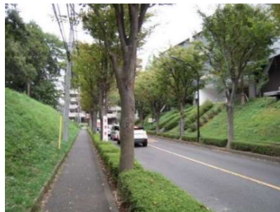
▲南1604号線※2018年6月に廃止