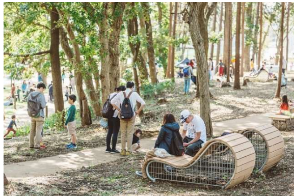
▲既存の樹林を活かし再編した鶴間公園

本プロジェクトは、田園都市線「南町田グランベリーパーク駅」(2019年10月1日に「南町田駅」から改称)南側に広がる鶴間公園と2017年2月に閉館したグランベリーモール跡地を中心とする約22haのエリアについて、官民が連携し、都市基盤・商業施設・都市公園・駅などを一体的に再整備・再構築し、「新しい暮らしの拠点」の創出に取り組むまちづくりプロジェクトです。