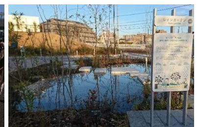
▲雨のにな: レインガーデン