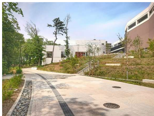
▲公園と商業をつなぐパークライフ・サイト内歩行者通路