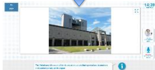
AIチャット画面(文化施設案内)