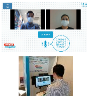
▲イメージ写真②(遠隔接客)