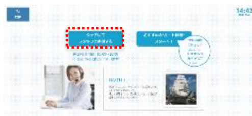
【おすすめルート提案の場合】 「タッチしてスタッフと通話する」を選択