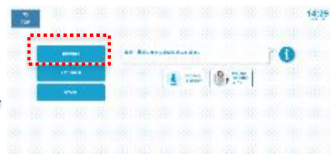
案内を希望する施設を選択