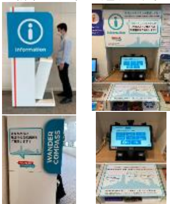
▲イメージ写真①(端末) ※左:自立型 右:卓上型