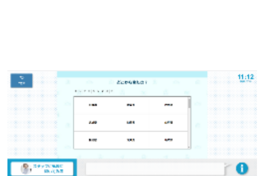
▲イメージ写真③ (おすすめルート提案(たび診断))