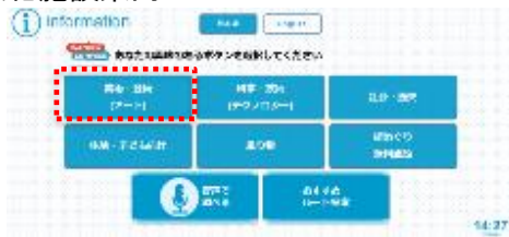
興味のあるジャンルを選択