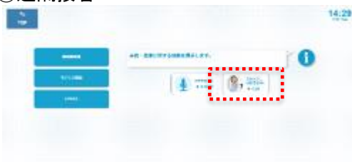
【文化施設案内の場合】 「スタッフに行き方を聞いてみる」を選択