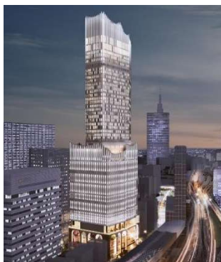
▲建物外観イメージ