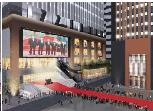
▲シネシティ広場とエントランス部分イメージ