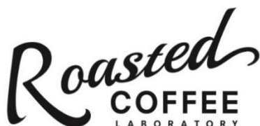
▲「ローステッドコーヒー」ロゴ

HP : https://www.flavorworks.co.jp/brand/roastedcoffeeLaboratory.html