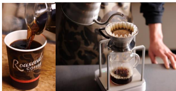
▲「ローステッドコーヒー」イメージ