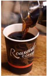
▲ローステッドコーヒー