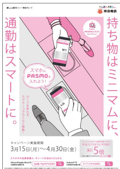
▲本キャンペーンビジュアル

※③・④については次のリンクからご登録が可能です( https://www.topcard.co.jp/choose/ )