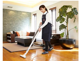
家事代行(掃除機掛けなど)