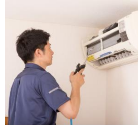
ハウスクリーニング(エアコンなど)