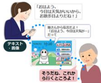
家族間のコミュニケーション

「Tablet PaPeRo」を通じて、離れて暮らす家族と相手の都合や時間を気にせず、伝言の送受信ができます。また、家族が登録した病院の予定やごみ出しの日などの予定をお知らせすることも可能です。