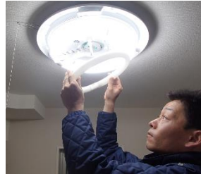
軽作業(電球交換など)