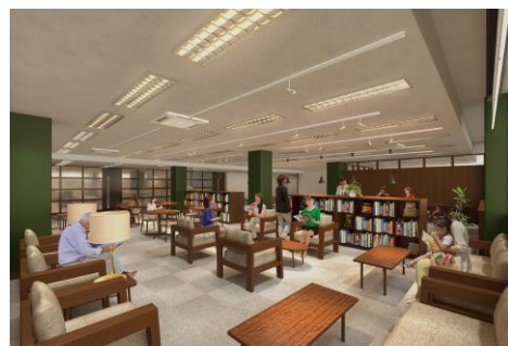
▲2階ブックラウンジイメージ