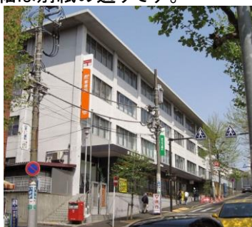
▲青葉台郵便局外観