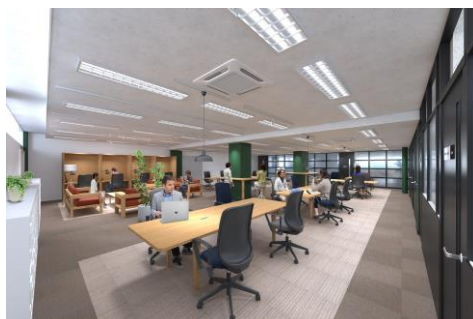
▲2階ワークラウンジイメージ