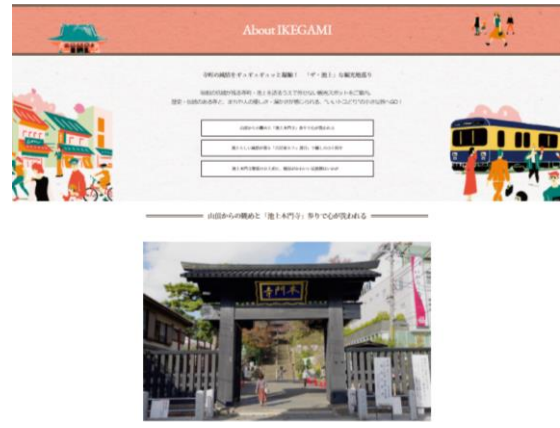
▲スポット紹介記事(イメージ)