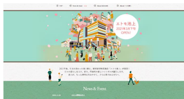
▲エトモ池上ティザーサイト(イメージ)