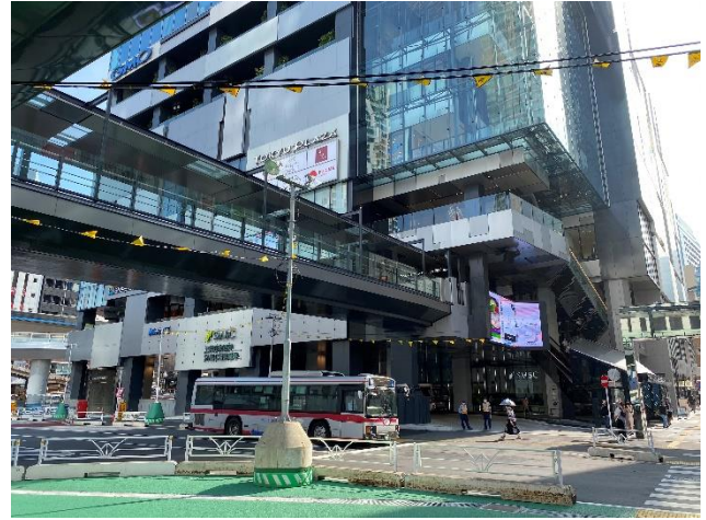
渋谷フクラス接続デッキ