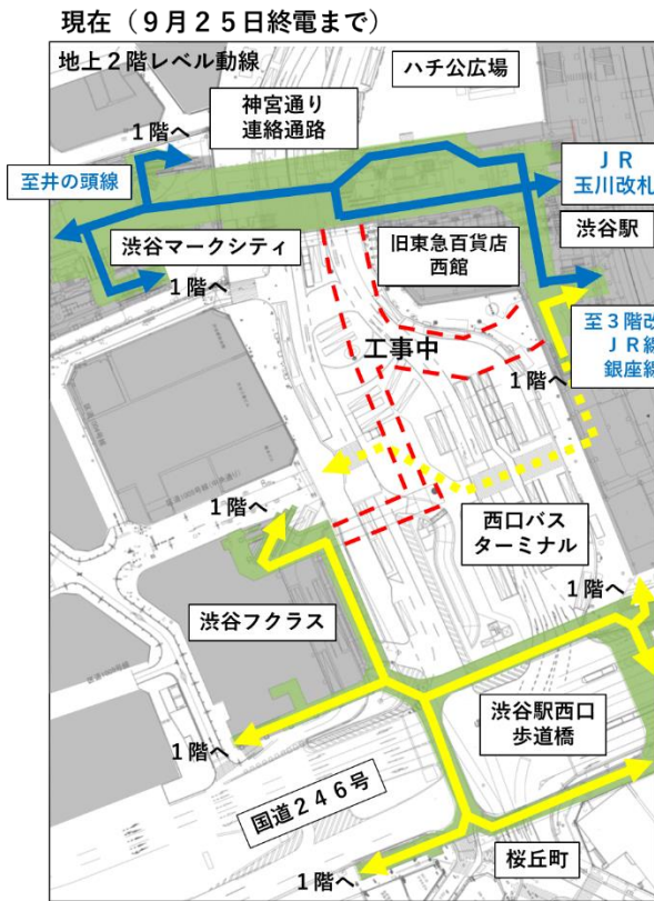
歩行者デッキ供用開始前後の利用動線