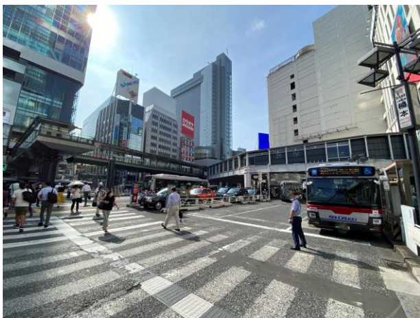
歩行者デッキ全景（渋谷駅方面から見る）