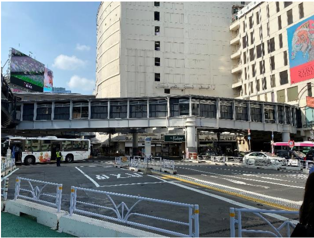
(仮称) 西口連絡通路