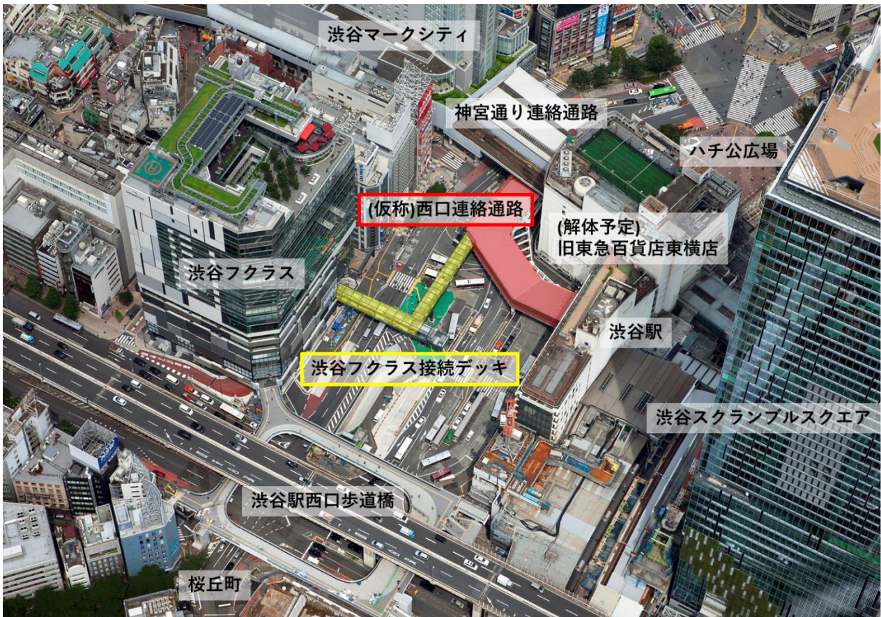
歩行者デッキ全体図