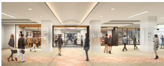
▲あざみ野駅構内イメージ