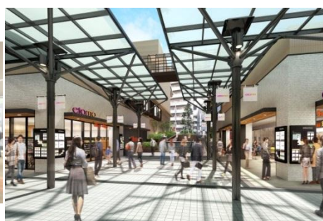
▲東急あざみ野ビルイメージ