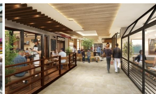
▲第2東急あざみ野ビルイメージ