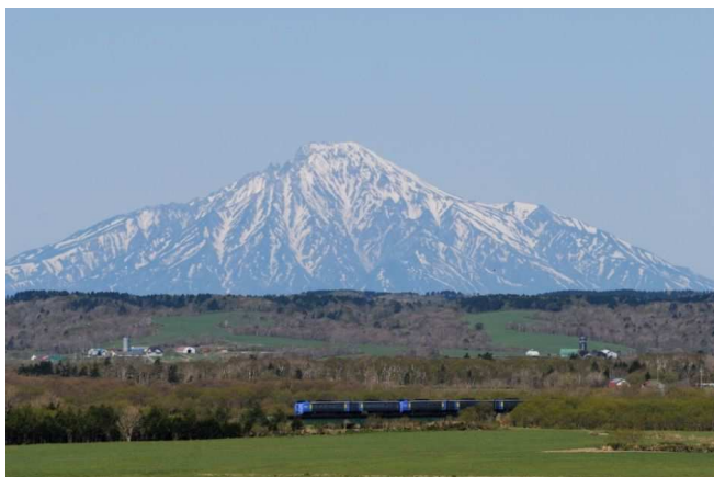
【サロベツ原野と利尻富士】