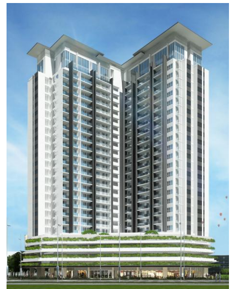
物件完成予想図(建物外観)

また、三菱地所グループはこれまでにベトナム・ホーチミン市にて計約2,000戸の住宅を分譲し、ハノイでは約1,300戸の住宅開発を行っています。ベトナムにおけるプロジェクトは初参画となる三菱地所レジデンスは、現地デベロッパーとの合弁会社を立ち上げているタイをはじめ、マレーシア、インドネシア、オーストラリアでの住宅開発事業に参画しており、現在までに参画した案件は24物件(総戸数19,000戸超)となっています。