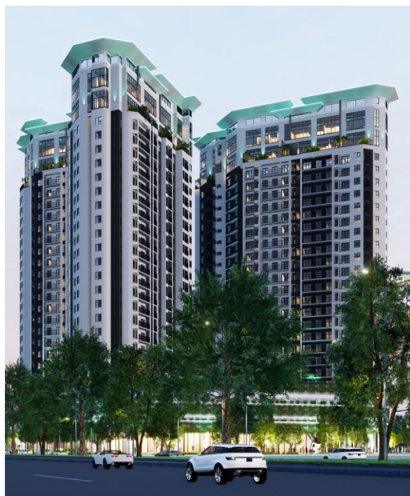
(X字の特徴的な外観)