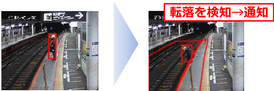
(転落検知支援システムの仕組み)