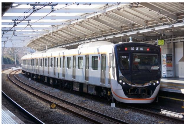
▲大井町線新型車両6020系