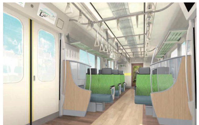
▲新型車両6020系車両内装イメージ(クロスシート状態)