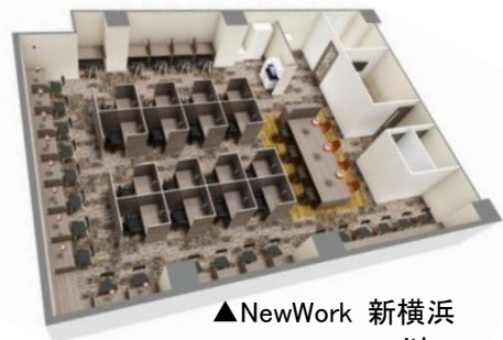
▲NewWork 新横浜 以 上