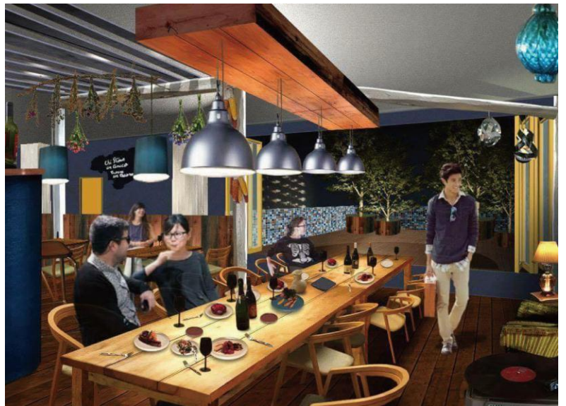
▲レストランイメージ