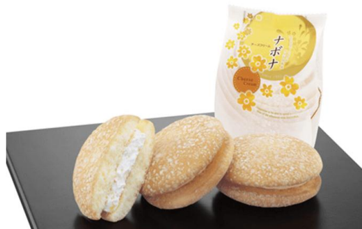
亀屋万年堂「ナボナ」