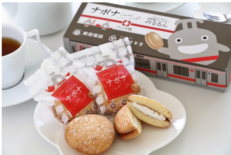
のるるんナボナイメージ