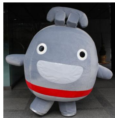
東急線キャラクター「のるるん」