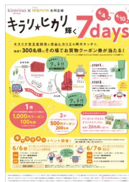
ポスターのイメージ