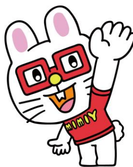
株式会社アミューズ所属キャラクター 「ミミー」