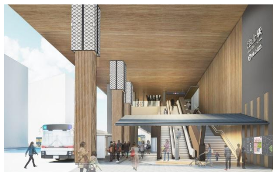
北側の駅出入口イメージ