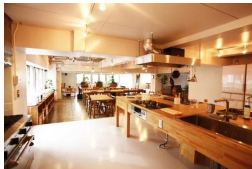
スタイリオウイズ上池台