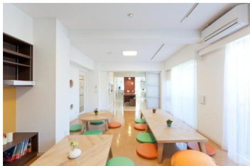
スタイリオウイズ代官山