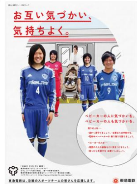
日体大 FIELDS 「車内での飲食・化粧」編