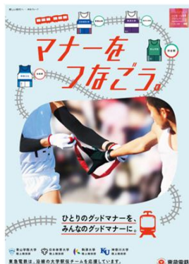
青山学院大学・駒澤大学 日本体育大学・神奈川大学 「マナーをつなごう」編