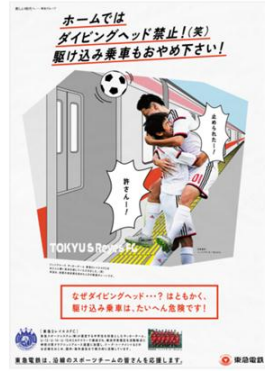
東急レイエス 「駆け込み乗車」編