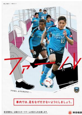
川崎フロンターレ 「座席の座り方①」編