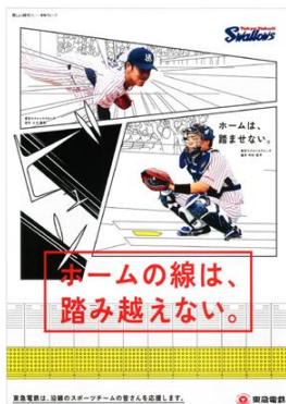
東京ヤクルト・スワローズ 「ホーム上の歩き方」編