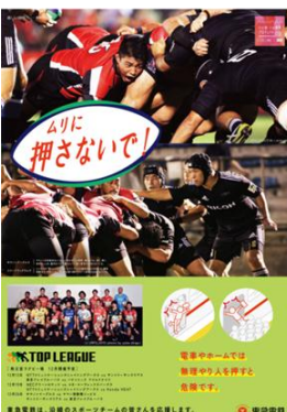
キャンンイーグルス リコーブラックラムズ 「無理に押さない」編