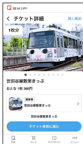
▲東急線アプリ内での商品交換画面イメージ