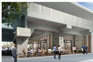
【目黒川沿いテラススペースイメージ】