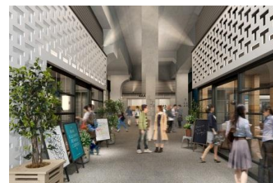
【山手通り沿い施設内イメージ】

当社は、東京地下鉄株式会社と共同で、「中目黒高架下」(以下、本施設)を2016年11月に開業します。このたび、本施設の名称、ロゴ、および出店する全28店舗が決定しました。