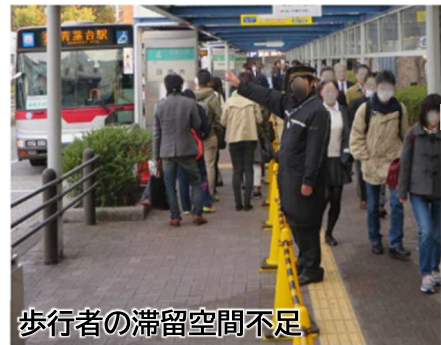
歩行者の滞留空間不足