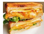
EPIC BLT サンド