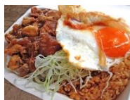
Jule's spices ナシゴレンと鶏そぼろ