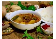
FIRE SAURUS チキンカレー