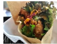
COCORIRE vegan トルティーヤタコス