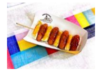
Koke Koko ソトック ソトック