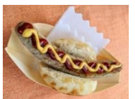
BARDUHN ドイツデリカテッセン あらびきソーセージドッグ