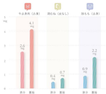
キレイ栄養素比較 (鉄分・亜鉛)

また高たんぱく質な観点からダイエットには鶏肉、と思いがちですが、実は、鉄分、亜鉛があまり含まれていません。痩せても肌が荒れてボロボロでは意味がありません。大豆などの植物性たんぱく質や、野菜などの鉄分も、栄養の吸収率と言う点から、動物性より劣ります。週 2 回「bf」を食べることで、不足しがちな栄養素を効率よく足す、という意味から「食べる美容液」と呼んでいます。