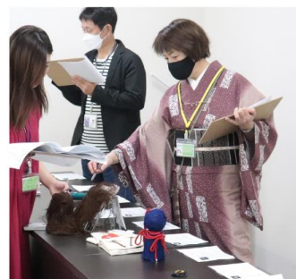
最終審査の様子 2023年9月撮影 ニッセン本社内会議室