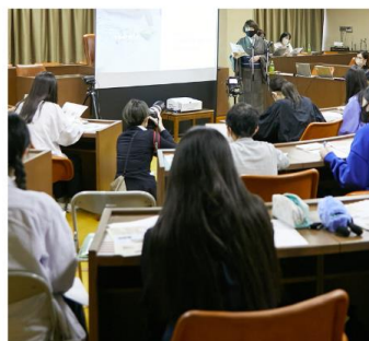
「西陣織」の説明を聞く学生 2023年5月撮影 西陣織会館内会議室

11月には、多数の応募作品の中から選ばれた優秀賞の表彰式を西陣織会館で開催しました。