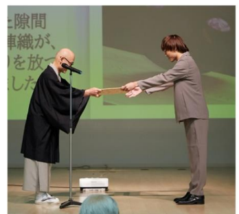
表彰式の様子 2023年11月撮影 西陣織会館内大ホール