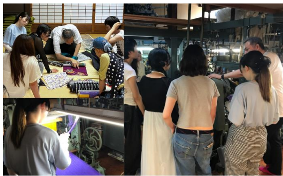
西陣織の老舗幡屋「今河織物株式会社」の工房で、 工程や技術を学ぶ学生 2024年6月撮影