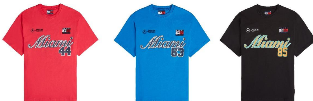
TOMMY x MERCEDES-AMG F1xAWAKE NY T シャツ 29,700 円 (税込)

F1 にクラシックなベースボール ジャージを用いることでアメリカナのエッセンスを取り入れ、マイアミグランプリのためにつくられた T シャツはディーパピンク、エレクトリックブルーレモネードとブラックの3色を展開。ロングスリーブ、ポロシャツ、ベースボール ジャージ、ラグビーシャツには Tommy、Awake NY、メルセデス-AMG ペトロナス F1 チームのロゴが配されています。T シャツ