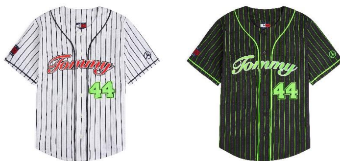
TOMMY x MERCEDES-AMG F1 x AWAKE NY ベースボールジャージシャツ 42,900 円 (税込)

ommy x Mercedes-AMG F1 x Awake NY コレクションは、レーシングとニューヨークのストリートカルチャーが持つ美学から着想を得て、アーカイブにある定番アイテムを再構築した7つのジェンダーレスなスタイルから構成されています。