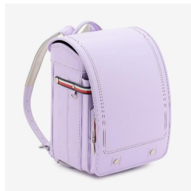
ライラック (百貨店ランドセル売り場限定色)