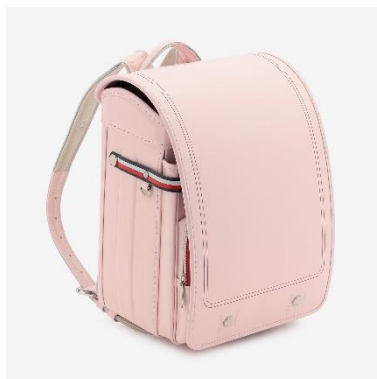
ネールピンク (tommy.com 限定色)