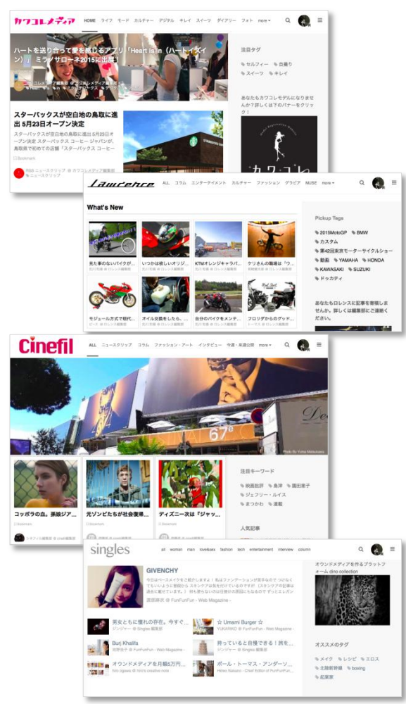
※様々なデザインへとカスタマイズ可能なトップ画面