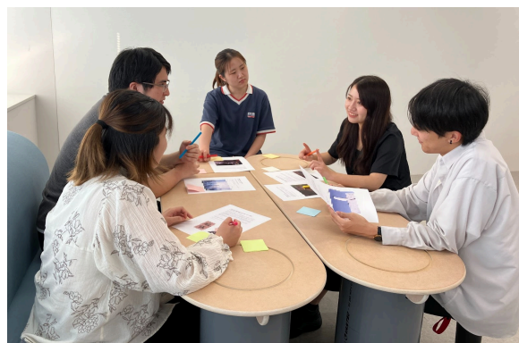
(社内でのGX勉強会の様子)