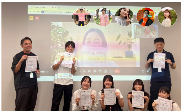
(炭素会計アドバイザー取得者)

※これまでもGX人材育成のため「炭素会計アドバイザー」や「LCAF：LCA検定試験」などの各種資格の取得や研修・勉強会を進めてきました（※4）。