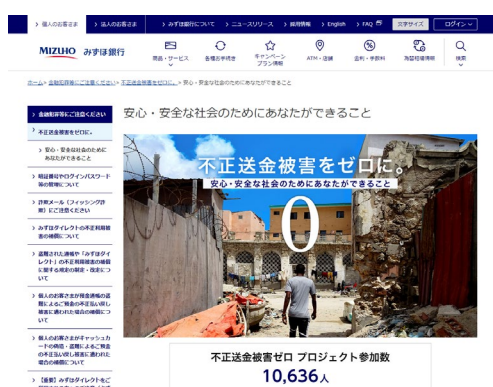
※「不正送金被害ゼロプロジェクト」みずほ銀行Webサイト

本プロジェクトで、ソーシャルインパクト（社会的影響力）の可視化と申込数が増えるほど課題解決に貢献できる「顧客参加型」の取り組みを実施した結果、ワンタイムパスワードのユーザー申込数を従来型訴求に比べ約28倍に増加させることができました。