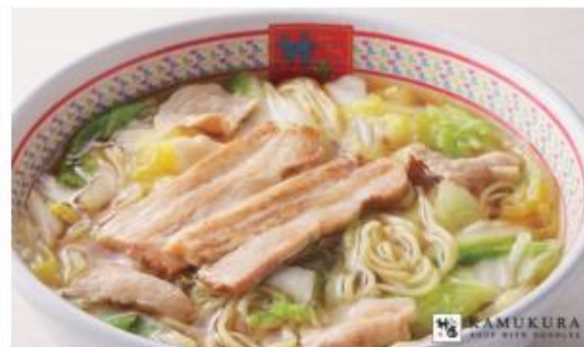
【神座看板メニュー：おいしいラーメン】 ※価格は店舗によって異なります。

現在は、東京・関西を中心に39店舗を展開しており、各店舗女性が一人で入っても、安心して食事ができるような明るく清潔な店内になっています。