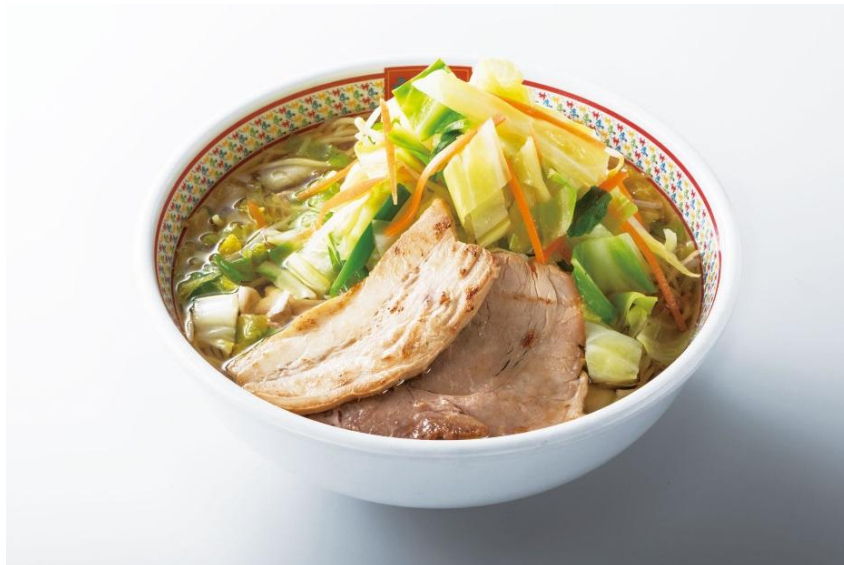
■野菜いっぱいラーメン

どうとんぼり神座の新メニュー「野菜いっぱいラーメン」を、是非一度ご賞味ください。