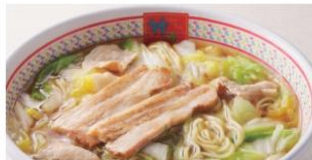
【神座看板メニュー：おいしいラーメン】 ※価格は店舗によって異なります。

この「おいしいラーメン」の人気により、大阪・道頓堀に4坪9席からスタートした店は、1日500杯以上を売り上げる人気店になりました。現在は、東京・関西を中心に36店舗を展開しています。