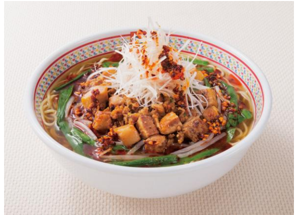
神座特製 台湾ラーメン