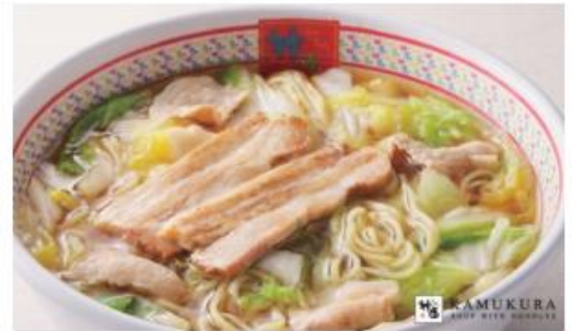
【看板メニュー/おいしいラーメン 530円】 ※価格は販売エリアにて異なります