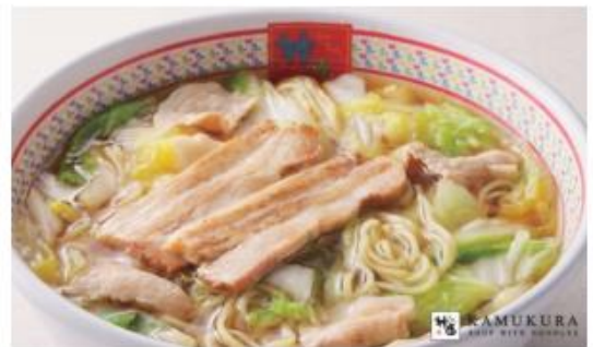
【神座看板メニュー：おいしいラーメン】 ※価格は店舗によって異なります。

世界のお客様に向け、「3回食べたならやめられない」神座の味をさらに広く提供していきます。