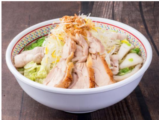
■蒸し鶏と白髪ねぎのおいしいラーメン 価格：815円（税抜）/880円（税込）

※関西国際空港店・香芝SA店 889円（税込：960円） ※神座飲茶樓横浜ジョイナス・東京グランルーフ店のみ 1013円（税込：1195円）にて販売