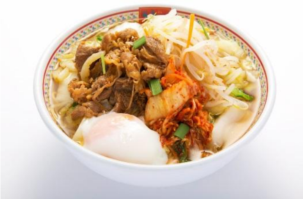
■秋のピリ辛 牛カルビラーメン 862円（税抜）/930円（税込）