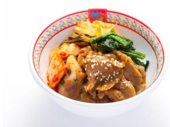
■牛カルビ ビビンバ 単品：463円（税抜）/500円（税込） セット：399円（税抜）/430円（税込）

※香芝店・香芝SA店・長吉店・河内長野店・鶴見店・平野店・イオン洛南店・イオンモール名古屋茶屋店ではお取扱いがございません。 ※神座飲茶楼 グランルーフ店・横浜ジョイナス店ではお取扱いがございません