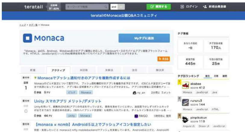
図4 Monaca 公式 Q&A ページ