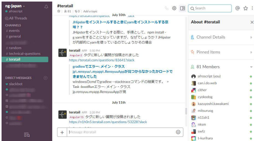
図3 Angular コミュニティ Slack 内の teratail チャンネル