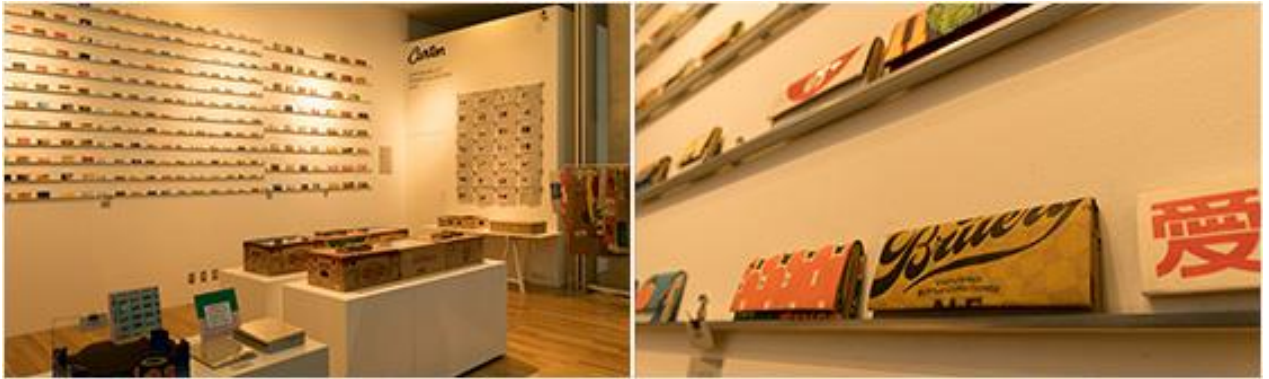
CARTON SPRING COLLECTION color@SOUVENIR FROM TOKYO 2018年1月～3月展示の様子

2018.12.7(金) YEBISU GARDEN CINEMA / 新宿ピカデリー、ミッドランドスクエアシネマ(名古屋)、 MOVIX京都、神戸国際松竹、MOVIX仙台、MOVIX橋本、ほか全国順次公開