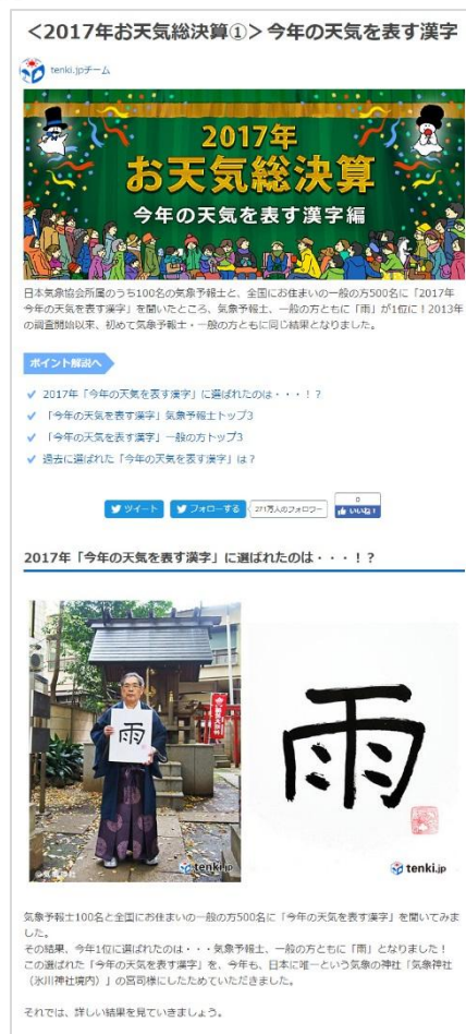
パソコンイメージ