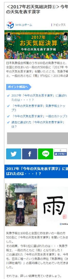
スマートフォンイメージ