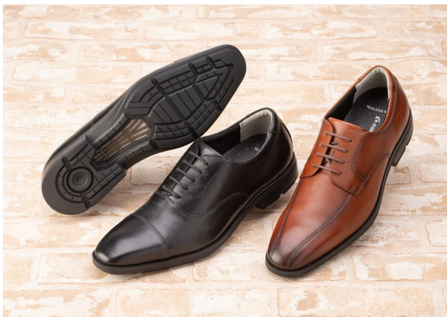
ブレスクール機能搭載の新作(左から) SPH4631BC SPH4630BC

気温が高くなるこれからの時期、靴内のムレを抑制し、ストレスを軽減し快適な歩きをサポートいたします。