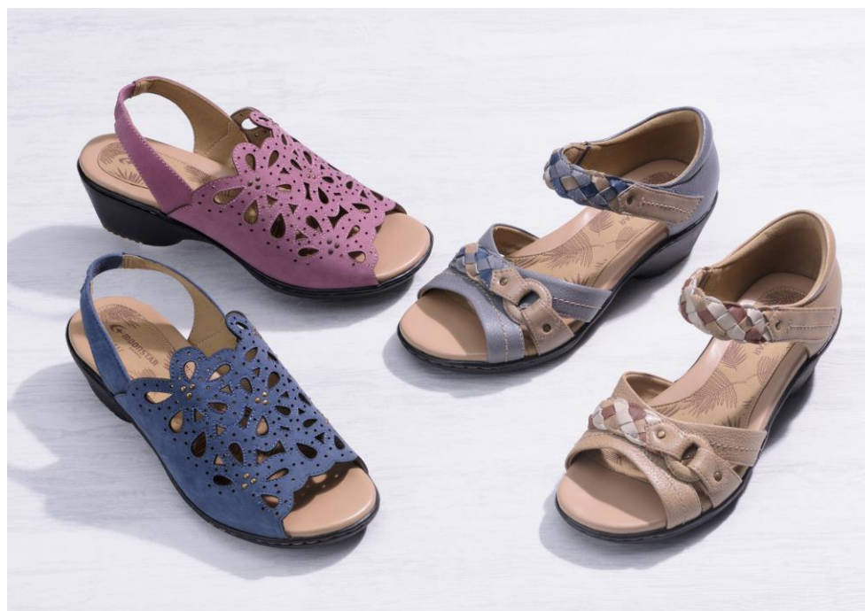
(右から)SP0430 ベージュC、ブルーC SP0431 ピンク、ブルー 税込価格 ¥10,584- (本体価 ¥9,800-)

今シーズンはレリーフ加工や編み込みなどクラフト感溢れるアクセント使いとスモーキーなカラーリングで大人のナチュラル夏スタイルを演出します。