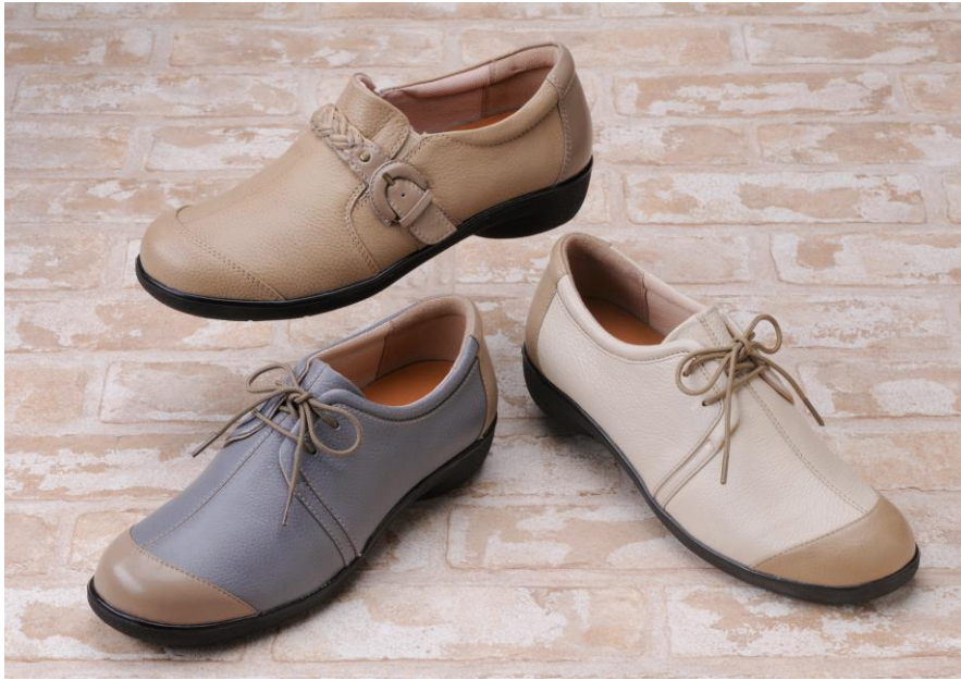
(上)SP1735 ベージュC (右)SP1705 アイボリーC (左)SP1705 ブルーC 税込価格 ¥10,584- (本体価 ¥9,800-)