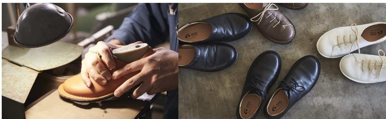
（左から時計回りに）SL スリッポン 01 ブラック、SL アワセ 01 ダークブラウン、SL アワセ 01 ホワイト、SL ハトメ 01 ブラック 税込価格：¥19,800-(本体価格¥18,000-) 素材:天然皮革(ステア) サイズ:22.5~24.5cm(3E) 日本製

また、ご来場の特典としてスロウファクトリーで使用のレザー製コードホルダーをご用意しております。（限定200名様）